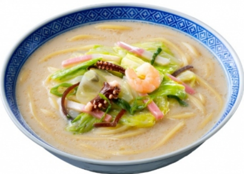
「四海樓監修 ちゃんぽん」